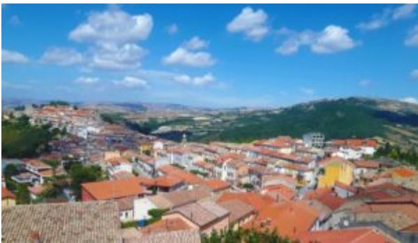
Savignano Irpino (AV)